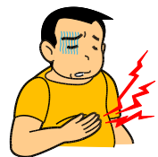
(maux d'estomac) (腹痛)