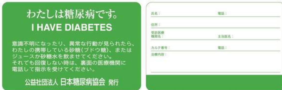
図3：糖尿病患者用 ID カード（緊急連絡用カード）

糖尿病患者であることを示す「糖尿病患者用 ID カード（緊急連絡用カード）」（図3）があります。いざという時のために財布などに入れて持ち歩くことができます。必要な方は医療機関でお申し出ください。